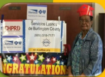
Virginia says she learned a lot and she liked everything that was done in the workshop because she did things she had never done before such as creating a plan of action to incorporate healthy habits in her lifestyle. She started drinking more water and exercising and she says this has helped her a lot.

Community Outreach Promoción Comunitaria