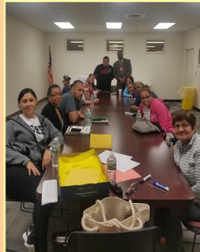
ESL/Citizenship Classes (Clases de Ingles y Ciudadania)