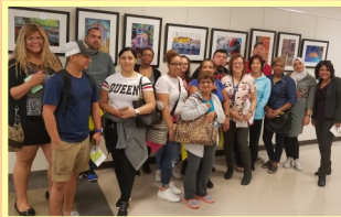
ESL County's Library Trip (viaje a la biblioteca)